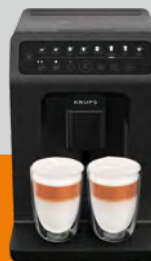
Evidence Eco Design EA897