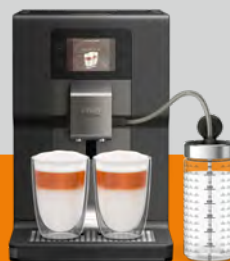
Intuition Preference+ EA875