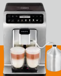
Evidence Plus EA894