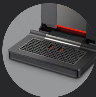
Wyjmowana tacka ociekowa

Opróżnianie i przemywanie tacki ociekowej oraz pojemnika na fusy to podstawa codziennej dbałości o ekspres KRUPS. Elementy te są łatwo dostępne dla maksymalnie wygodnej konserwacji.