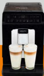
Evidence Essential EA890