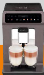
Evidence One EA895