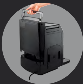
Wyjmowany zbiornik na wodę