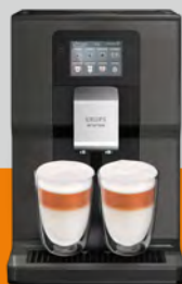
Intuition Preference EA872